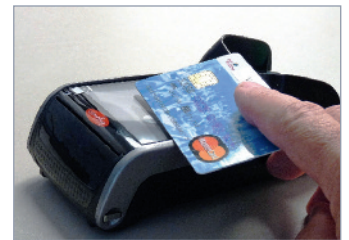
Integrierter Kontaktlos-Leser iWL250