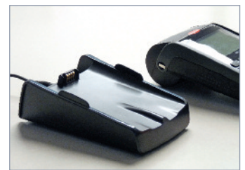
Basisstation zum Laden